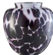
6084 / 268 SPLASH VASE WEISS / SCHWARZ VASE WHITE / BLACK h 268 mm / 10.5 in ø 267 mm / 10.5 in 119 378 EAN 4001836087414