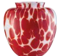
6084 / 268 SPLASH VASE WEISS / ROT VASE WHITE / RED h 268 mm / 10.5 in ø 267 mm / 10.5 in 119 379 EAN 4001836087438