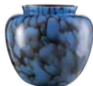
6084 / 208 SPLASH VASE SCHWARZ / BLAU VASE BLACK / BLUE h 208 mm / 8.2 in ø 232 mm / 9.1 in 119 376 EAN 4001836087391

Arranged in a group, these multifaceted unique pieces give distinction to sophisticated interiors. Even as stand-alone objects, the SPLASH series is an eye-catching feature of any room.