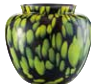
6084 / 208 SPLASH VASE SCHWARZ / LEMON VASE BLACK / LEMON h 208 mm / 8.2 in ø 232 mm / 9.1 in 119 377 EAN 4001836087407