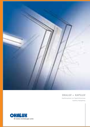
OKALUX + KAPILUX