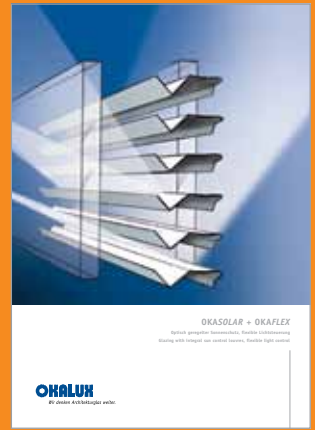
OKASOLAR + OKAFLEX